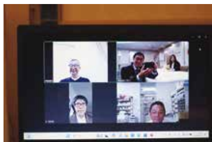
オンライン出席の皆さま

会員数 53名 (出席免除者0名) 出席者数 35名 欠席者数 18名 出席率 66.04%