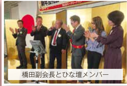
橋田副会長とひな壇メンバー