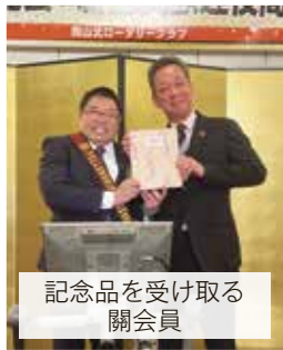
記念品を受け取る 關会員