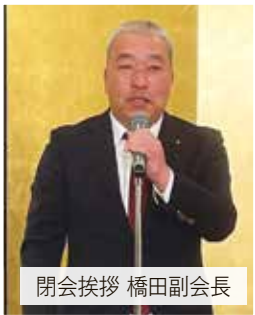
閉会挨拶 橋田副会長