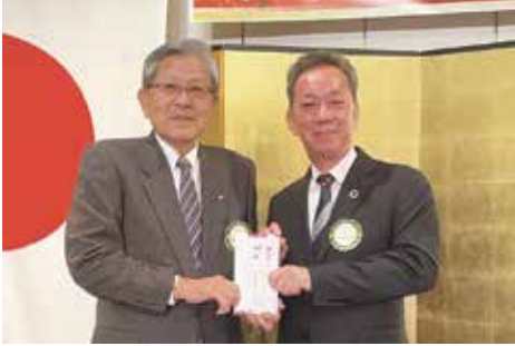
長寿・年男のお祝い 傘寿 皆木会員