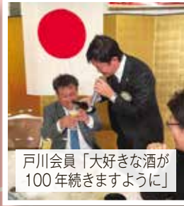
戸川会員「大好きな酒が 100年続きますように」