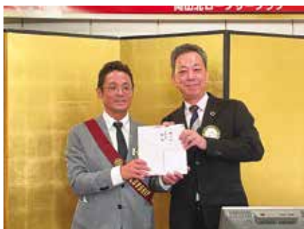
誕生日の河口会員