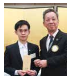
ヴァン君 1月分奨学金授与