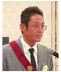
長寿・年男のお祝い 進行の河口会員