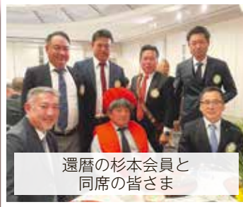
還暦の杉本会員と 同席の皆さま