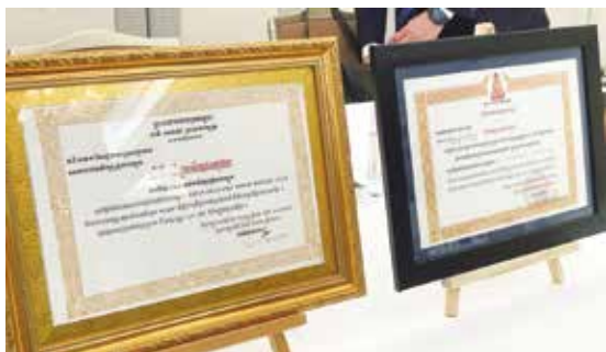
カンボジアで小学校とお寺からいただいた感謝状