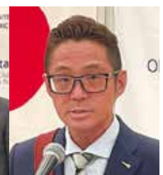
お祝い行事進行の 河口会員