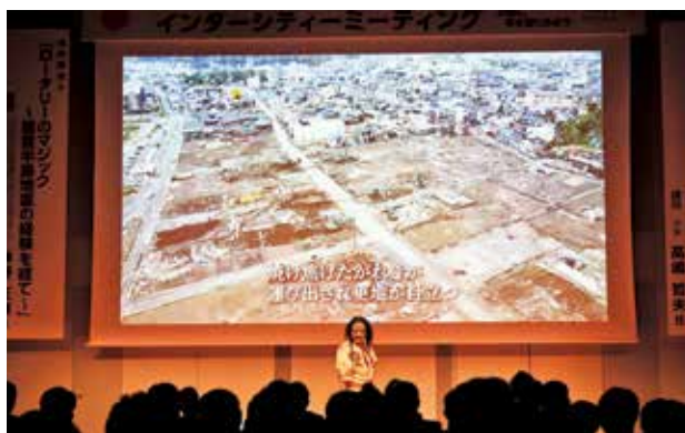
能登半島の震災の映像をバックに石川県無形文化財「御陣乗太鼓」を特別演奏