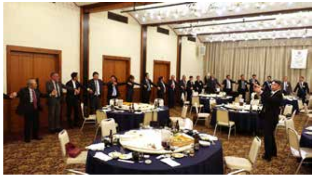
全員で手に手つないで