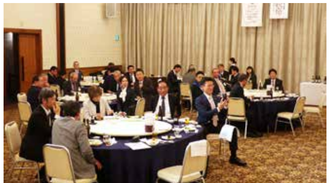
歓談のひとつとき