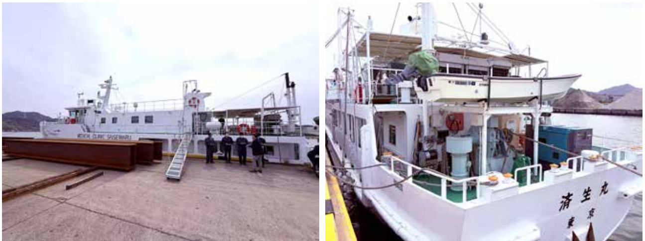
新潟山港に停泊の済生丸