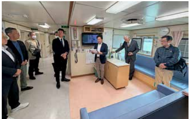
空気清浄機の贈呈を