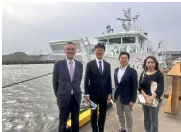
委員会の皆様御苦勞様でした