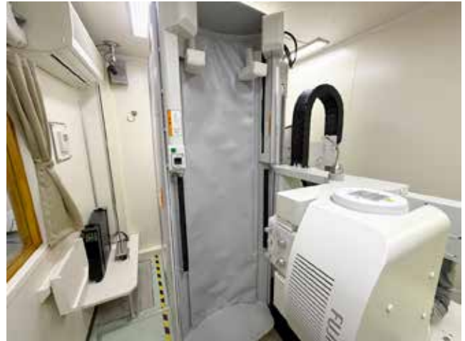
限られたスペースで設置を工夫された設備を紹介