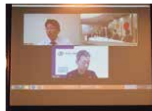
オンライン参加 ありがとうございます

2月8日の創立記念日には何らかの形で社会奉仕事業を開催したいと考えております。皆様のご協力をよろしく申し上げます。