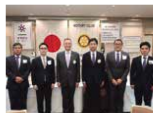
6ロータリークラブ 幹事の皆さんと