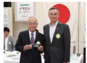
6月お誕生日お祝いの鴻上会員