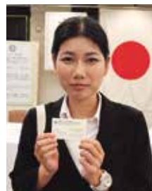
名刺を作りましたとアイン米山奨学生

4日(火) 18:00~第1回理事役員会 19:00~例会: 旧ひな壇慰労&新会員歓迎夜間例会 11日(火) 12:30~例会: 就任挨拶 18日(火) 例会取消し(定款第7条第1節) 25日(火) 12:30~例会: 就任挨拶