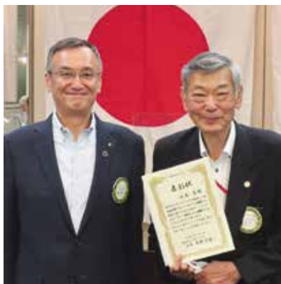
谷本会員 副会長として100%を達成していただきました。