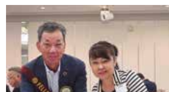
岡山北RC・岡山北西RC 親睦活動委員長 8月22日の 合同例会の打ち合わせ