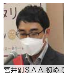
宮井副S.A.A.初めてのスマイル報告