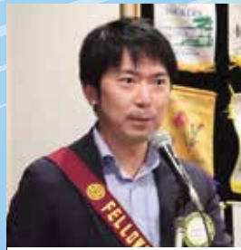
馬場親睦活動委員長の見事な進行