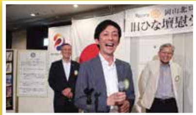
とりは旧ひな壇の熱唱