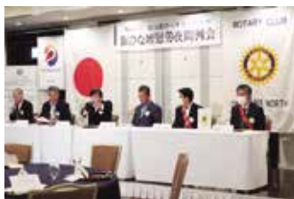
新しい壇スタート