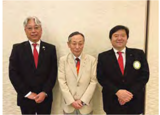
ガバナー公式訪問例会前に会長、次期会長、幹事との懇談会が開催されました。