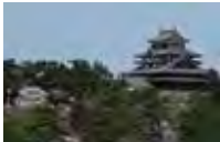
ガバナー 石倉貞昭 (松江しんじ湖RC)