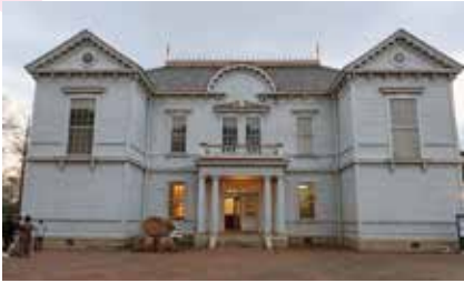
会場キューティパイ倶楽部

キューティパイ倶楽部で7年ぶりに「夜桜の宴」を開催しました。桜の開花はまだでしたが、アトラクションの演奏で春の雰囲気盛り上げていただきました。