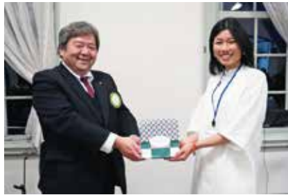
送別プレゼント贈呈