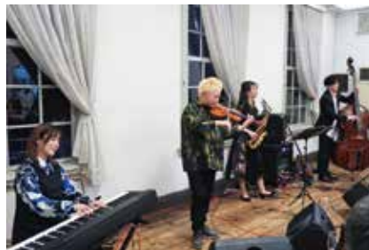
アトラクション演奏