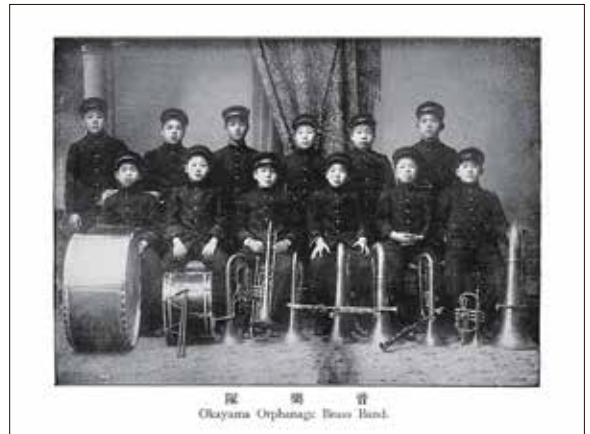
探 樂 音 Okayama Orphanage Brass Band.