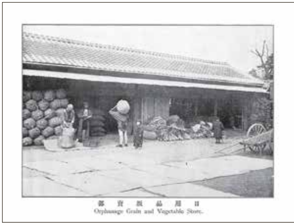
食糧も大変な量が