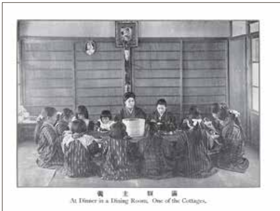
備 主 膳 備 At Dinner in a Dining Room, One of the Cottages.