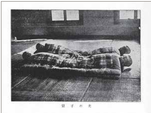
1枚の布団によりそって