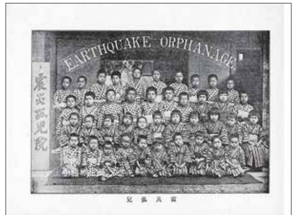
震災の孤児達を受け入れ