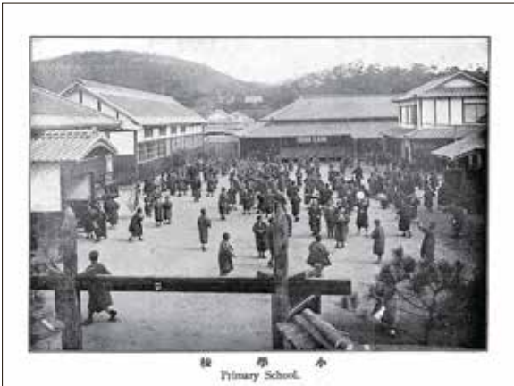
校 学 小 Primary School.