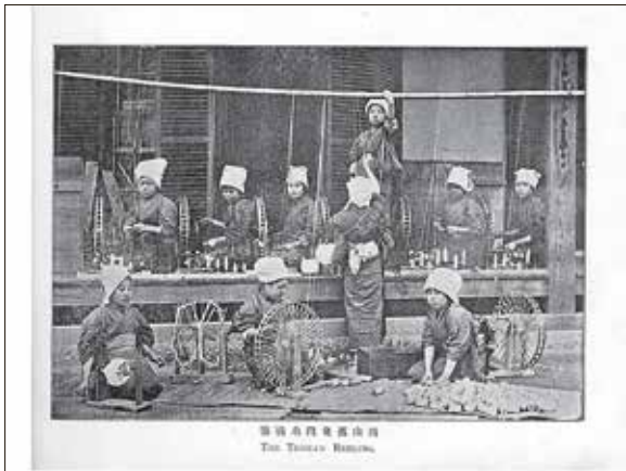
華清島陸奥郡山形 The Tenryo Broom