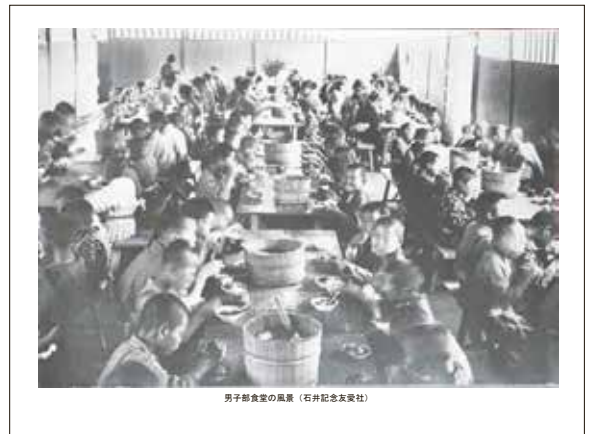
男子部食堂の風景 (石井記念友愛社)