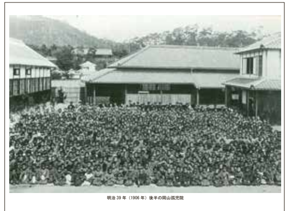
明治 39 年 (1906 年) 後半の岡山孤児院