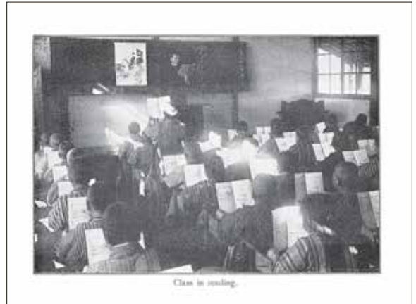
Class in reading.