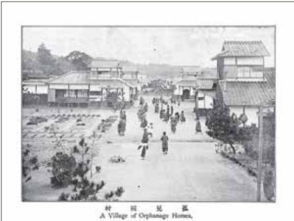
村 院 児 孤 A Village of Orphanage Homes.