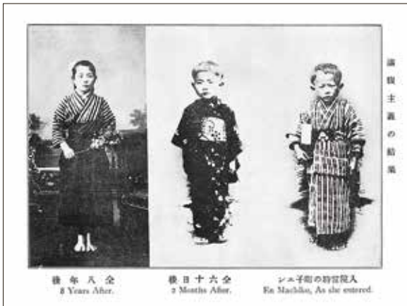
後 年 八 全 8 Years After.