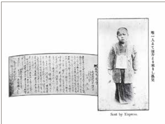
岡山孤児院行きの札をかけられた子供が全国から汽車に乗せられて