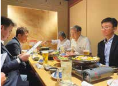
懇親会場に移動後も引き続き解説