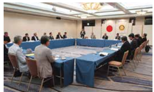
ガバナー補佐訪問クラブ協議会