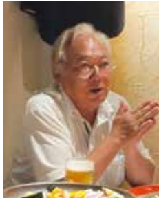
乾杯挨拶 安原会員