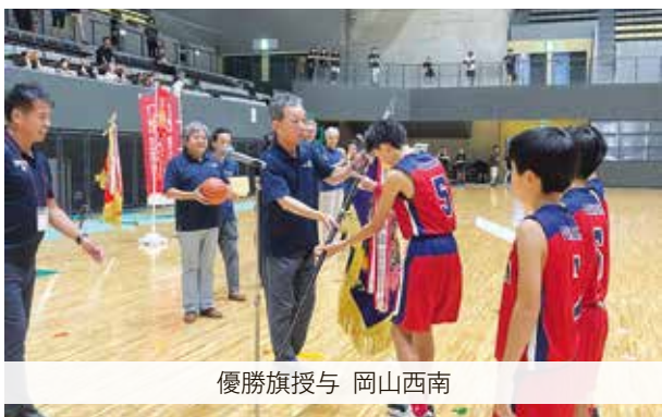
優勝旗授与 岡山西南