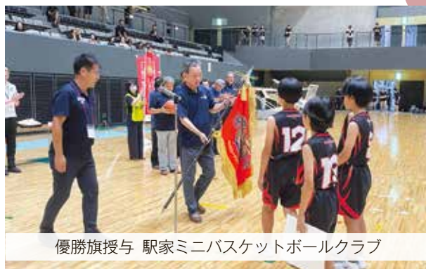
優勝旗授与 駅家ミニバスケットボールクラブ