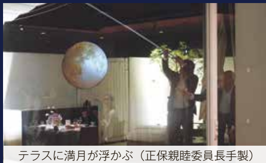
テラスに満月が浮かぶ（正保親睦委員長手製）