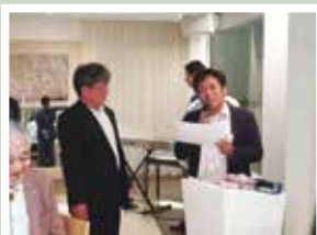
正保親睦委員長から杉本会員に配管洗浄プレゼント