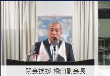
閉会挨拶 橋田副会長