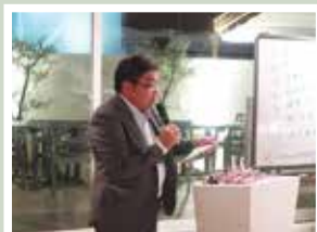
關会員からトイレの施工費贈呈